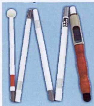
Sendereinbau in Blindenstock